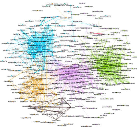
Figura 3 – Visualização do acoplamento bibliográfico das referências da pesquisa bibliográfica à base Scopus.

Os transtornos do espectro do autismo (TEA) se referem ao desenvolvimento neurológico, caracterizados por deficiências na interação social, na comunicação (ou seja, linguagem verbal e não verbal), por interesses restritos e comportamentos repetitivos. No entanto, a aplicação de robôs, como ferramenta terapêutica, mostrou resultados promissores, particularmente por causa da capacidade de melhorar o engajamento social ao provocar comportamentos sociais apropriados em crianças com tal espectro. Marchi, Ringeval e Schuller [7] apresentam uma revisão de exemplos reais de robôs habilitados por voz no contexto dos TEA, examinando o papel crítico que a prosódia desempenha na compensação da falta de reconhecimento de fala por crianças autistas. Contudo, eles ressaltam as limitações da tecnologia da fala no uso da robótica socialmente assistiva para jovens que sofrem de TEA.