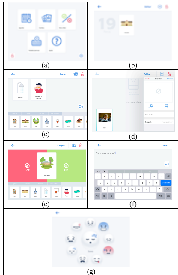
Figura 4 – O aplicativo Chups: (a) tela inicial; (b) rotina diária; (c) comunicação utilizando cartões; (d) criação de cartões personalizados; (e) pergunta e resposta (f) comunicação escrita; (g) expressão de sentimento.

A presença da voz nas diversas funcionalidades do aplicativo é um elemento de Acessibilidade que permite dar voz a autistas não verbais, dando a estes a liberdade de expressar suas vontades e opiniões. O Chups está disponível na App Store, apenas para iPad, ao custo de USD 4.99 (quatro dólares norte-americanos e noventa e nove centavos). O aplicativo foi desenvolvido para os idiomas português, inglês e espanhol.